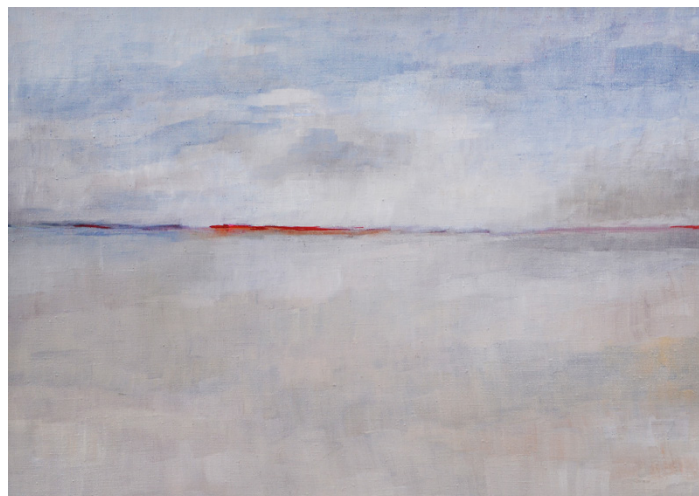
Elvi Rangellin Solitude 2.

vää pintaa. Maalaus Aamu kukkii kuin koivun kylki auringossa.